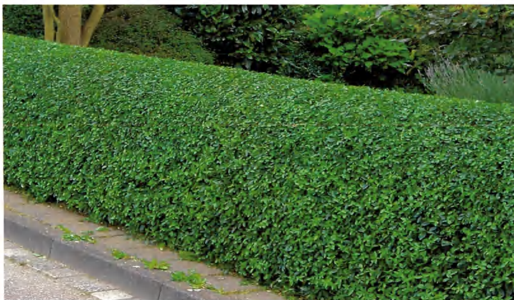
Som ni ser på bilden så finns inga utstående årsskott.

PUTSNING: Det är när man med sekator eller häcksax putsar dom yttersta topparna på busken/häcken. Denna beskärning görs under JAS-månaderna , men har man en sen blommande häck som t.ex. Ölandstok skall det göras på våren. Beskär aldrig under blomningsperioden tänk på våra pollinerare och mångfalden.