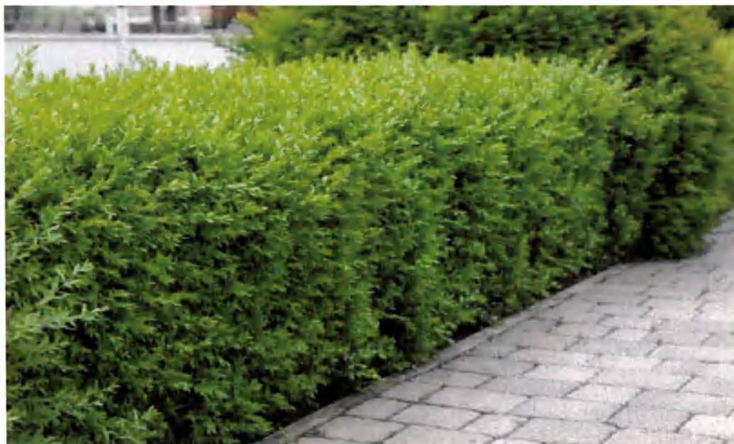
Denna har alla sina årsskott kvar och ser då ganska "rufsigt" ut.